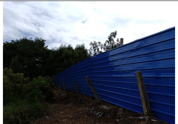
Imagen 7. Cerramiento perimetral del area,suelo urbano y rural