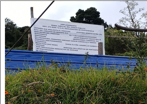
Imagen 6. Cerramiento perimetral del area -74.076995, 4,76118333, suelo urbano y rural