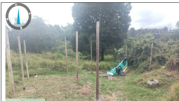
Imagen 4. Emplazamiento de estructura coordenadas 4.7589892, -74.0755483, suelo urbano

A continuación, relacionamos el registro fotográfico de los hechos, evidenciados el día 26 de septiembre de 2025.