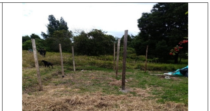
Imagen 5. Emplazamiento de estructura coordenadas 4.7588983, -74.075556, suelo urbano